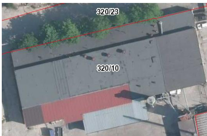
Rys. 1 Widok budynku z geoportalu